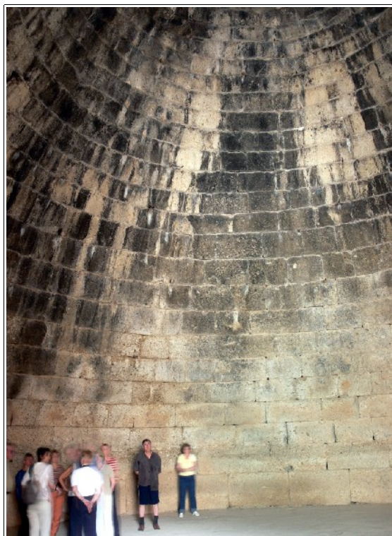
Atreuse varakambri võlvitud kuppel