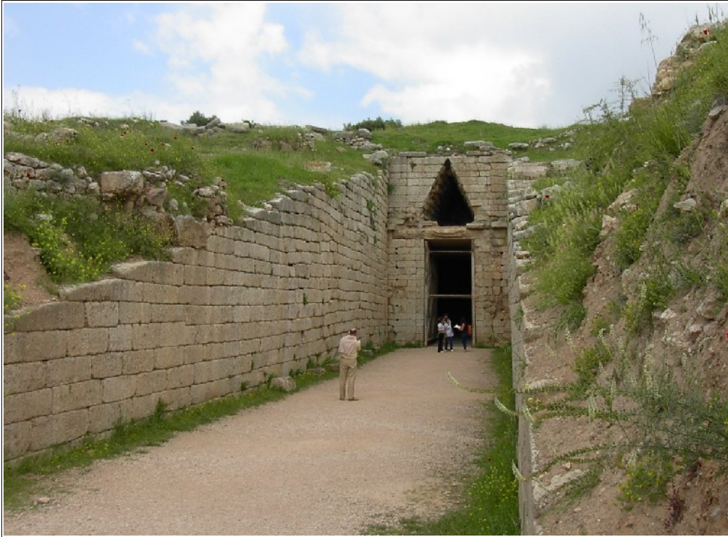
Atreuse varakambri fassaad. Algselt toetstasid seda sambad ja fassaad oli kaunistatud erinevate dekoratsioonidega. Hauakambrisse sisse viis kahe poolega uks.

üksteise suhtes astmeliselt. Hiljem raiuti telliste trepikujulised astangud maha ja tekkis kumer völv.