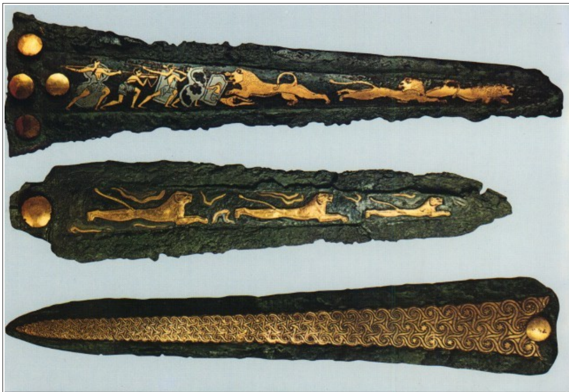
Kaunistatud jahipistodad haualeiust A