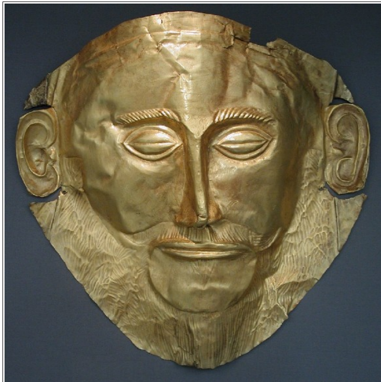
Agamemnoni surimask (ca 1500 - 1550)

Samm sammult Mükeene ja Kreeta suhted aga paranesid, kuni neist said liitlased ja kaubanduspartnerid. Alates 16. sajandist on Mükeenest leida eriti ohtralt kreetapäraseid hinnalisi ehteid, sealhulgas palju kuldesemeid. Sellest ajastust pärineb arvatavasti Mükeene haualeiust A avastatud kuulus „Agamemnoni surimask“, mis ennetab küll tänapäevase dateeringu järgi Agamemnoni eluaega.